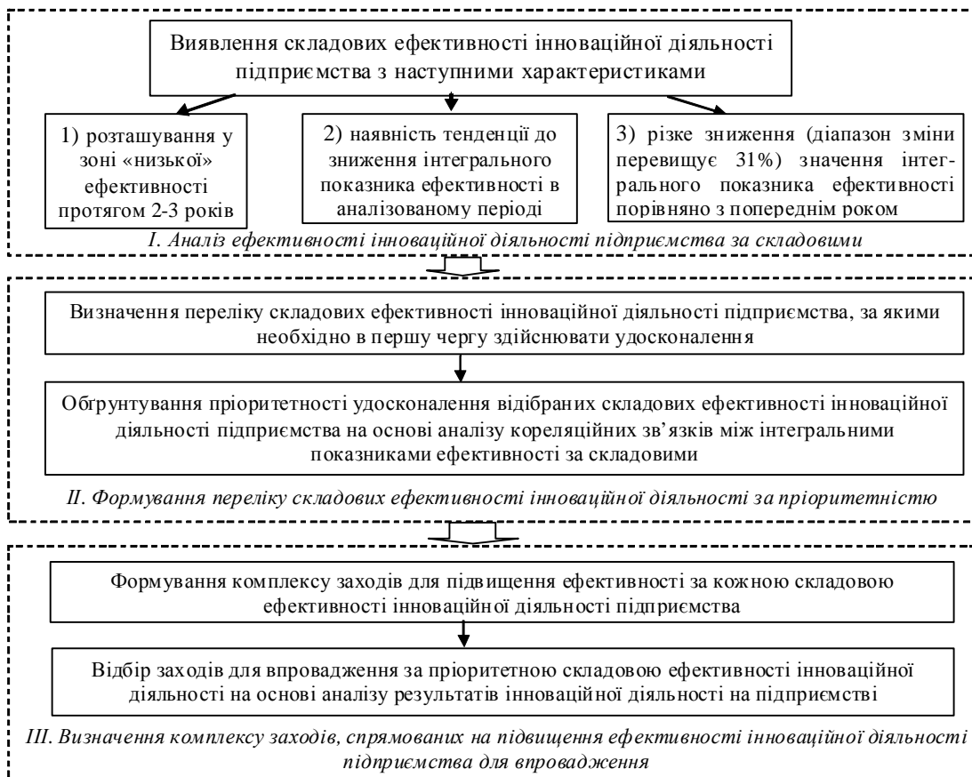
Рис. 2. Послідовність етапів відбору заходів щодо підвищення ефективності інноваційної діяльності підприємства за її складовими для впровадження на підприємстві

З урахуванням запропонованого підходу послідовність відбору та обґрунтування заходів для підвищення ефективності інноваційної діяльності підприємства має включати етапи, представлені на рис. 2.