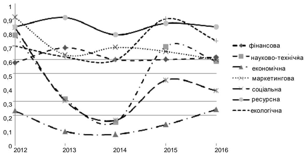
Рис. 4. Динаміка інтегральних показників ефективності інноваційної діяльності за її складовими на ТОВ "Карпатнафтохім"