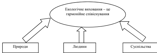
Рис. 3. Основні складові екологічного виховання