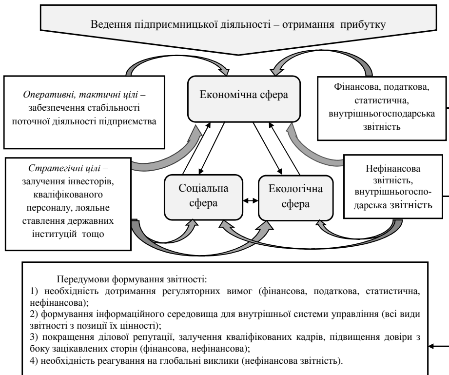
Рис. 2. Економічна, соціальна та екологічна складові діяльності підприємства та їх взаємозв'язок

визначили спільний вектор, направлений на окреслення і реалізацію соціальних та природоохоронних цілей і розвиток в подальшому нефінансової звітності. Кожна з наведених форм звітності відіграє певну роль в досягненні оперативних, тактичних та стратегічних цілей, причому нефінансова звітність здебільшого орієнтована на далеку перспективу розвитку підприємства.