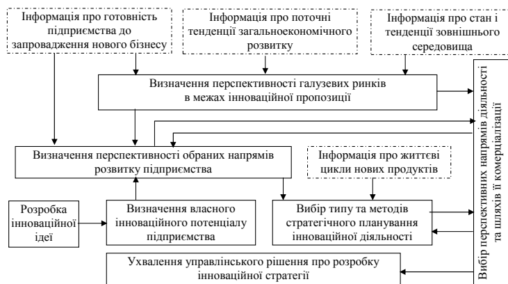
Рис. 1. Інформаційні потоки для побудови інноваційної стратегії підприємства

Стратегічна мета інноваційного розвитку підприємства полягає в стійкому економічному зростанні, що кількісно виявляється у збільшенні активів і обороту, а якісно характеризується стійкістю тенденцій зростання прибутковості та посиленням ринкових позицій підприємства [14]. Однією з визначальних особливостей стратегічного планування є володіння менеджерами достатнім обсягом професійних знань, зокрема вміння оперувати великими масивами інформаційних потоків (рис. 1) для прогнозування передових тенденцій розвитку економіки, якісного зосередження на розкритті інноваційного потенціалу підприємства й адекватній розробці стратегії випереджального захоплення ринку.