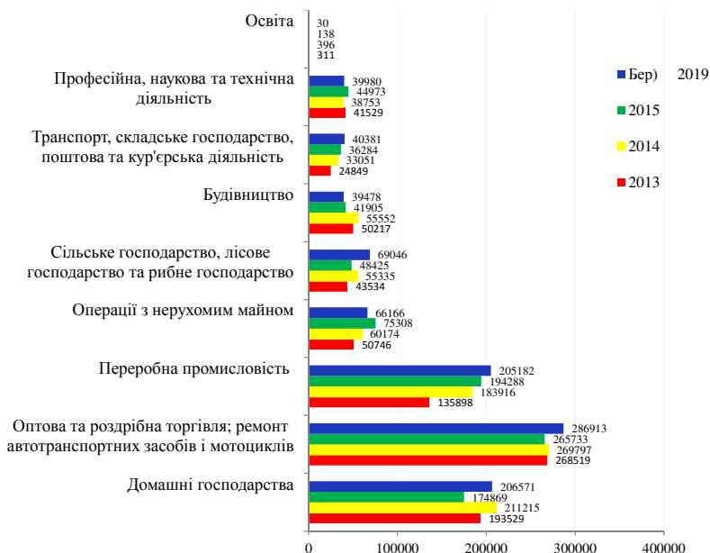
Рис. 1. Динаміка зміни сукупності виданих кредитів щодо галузей економіки (2013–2015, бер. 2019), млн грн [6]

Банківські установи виявили свою неспроможність кредитувати реальне виробництва, обумовлену недостатністю залучених та вільних ресурсів. Зазвичай банки проводять кредитне обслуговування тих клієнтів, яким вдалося продовжувати власне виробництво і після переломного 2014 р. Два роки підряд банківська система втрачала ліквідність, проте адміністративні обмеження НБУ стримували цей процес. Критичність структури активів банківських установ України також обумовлена ' рівнем непрацюючих кредитів. «За даними НБУ станом на 01.01.2018 кредитний портфель українських банків становить 1,07 трлн грн (40 млрд дол США); 2013 р. – (117 млрд дол США). Водночас «у корпоративному портфелі діючих банків сума непрацюючих кредитів становить 620 млрд грн, або 58%» [6]. «Найбільш ризикованими галузями економіки, де спостерігається висока частина непрацюючих кредитів, є: добувна промисловість – 83%, будівництво – 79%, хімічна промисловість – 69%, машинобудування – 64%, металургія – 63%» [1]. Динаміка сукупних наданих кредитів у розрізі галузей економіки відповідає тенденціям розвитку реального сектору економіки: основна частка кредитів направлена у гуртову та роздрібну торгівлю і промисловість, водночас кредитування інновацій (науки, технічної діяльності та освіти) є мізерним (рис. 1).