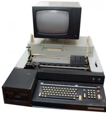
Рис. 1. Електронна бухгалтерська машина «Іскра 554 (555)» [2]

Зарубіжні альманахи з комп'ютерної тематики також присвячували розділи (випуски) ЕБМ «Іскра 554 (555)» через порівняння технічних і функціональних можливостей радянських та іноземних електронно-обчислювальних машин [7, с. 19; 8, с. 17]. На основі оцінювання переваг і недоліків ЕБМ, виготовлених у СРСР, зроблено висновок про перспективність їхнього використання для цілей автоматизації економічних процесів.