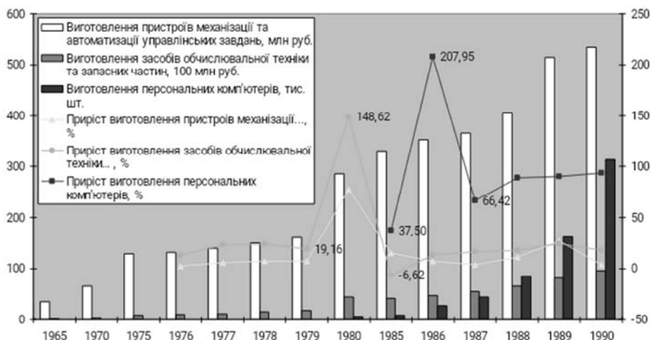
Рис. 2. Динаміка зростання кількості виготовлених засобів автоматизації управлінської діяльності та ЕОМ у СРСР

Виклад основного матеріалу дослідження. Інтенсифікація науково-технічного розвитку в СРСР відобразилася у щорічному, починаючи з 1970 р., зростанні кількості виготовлених засобів автоматизації управлінських робіт та ЕОМ. Ринок технічних засобів обробки інформації демонстрував перманентний щорічний приріст на 15–25% (рис. 2).