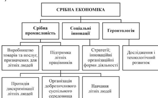
Рис. 1. Сфери діяльності «срібної економіки» за Г. Кшименевською

Польська вчена Гражина Кшименевська (Krzyminiewska Grażyna) у процесі розробки структури «срібної економіки» виокремила геронтологію як один із її напрямків (рис. 1).