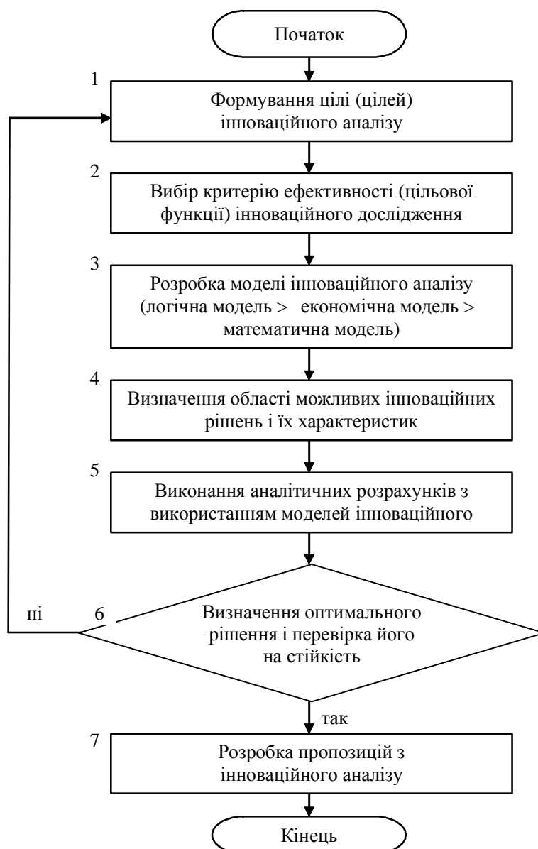
Рис. 3. Блок-схема проведення інноваційного аналізу на будівельних (підприємствах) організаціях

У цілому процедури інноваційного аналізу з використанням моделей на всіх стадіях створення інновацій включають низку послідовних типових етапів (рис. 3).