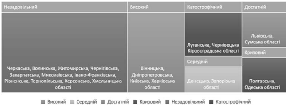
Рис. 3. Ранжування регіонів України за інтегральним індексом рівня управління корпоративною соціальною відповідальністю

Зазначимо, що в дисертаційній роботі Є. Коваленка запропоновано методику розрахунку інтегрального індексу рівня ефективності управління корпоративною соціальною відповідальністю [25]. Основною особливістю цього методу є розрахунок інтегрального індексу рівня ефективності управління корпоративною соціальною відповідальністю за регіонами на основі 31-го показника господарської діяльності. В результаті цього науковець здійснив ранжування областей України за інтегральним рівнем корпоративної соціальної відповідальності (рис. 3).