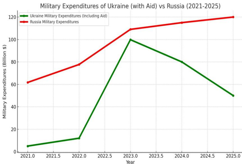
Рис. 4. Військові витрати росії та України (з міжнародною допомогою) за 2021–2025 рр. [23–24].

Як бачимо, для обох країн витрати на війну надзвичайно високі і витримувати їх на такому самому рівні тривалий час надзвичайно складно без погіршення невійськової складової економіки. Україна має критичні показники витрат, без допомоги союзників, насамперед країн ЄС, їй буде складно вести оборону (рис. 4).