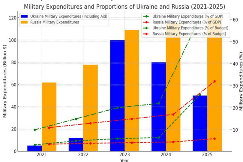
Рис. 3. Військові витрати росії та України у млрд дол. США, відсотках від ВВП та видатків бюджету за 2021–2025 рр.

З початку війни Конгрес США проголосував за п'ять законопроектів, за якими Україна отримує безперервну допомогу, останній раз це було зроблено в квітні 2024 р. Загальні бюджетні повноваження за цими законопроектами становлять 175 млрд дол. США. Остання сума у 68 млрд дол. може не бути реалізована за політичними мотивами у разі перемоги на виборах президента США Д. Трампа. На рисунку 3 показано обсяги військових видатків росії та України, у т. ч. міжнародна допомога, та їх відсоток від ВВП і у видатках бюджету.