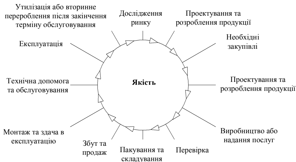
Рис. 1. «Алгоритм якості» або стадії життєвого циклу товару, на яких забезпечується якість продукції*