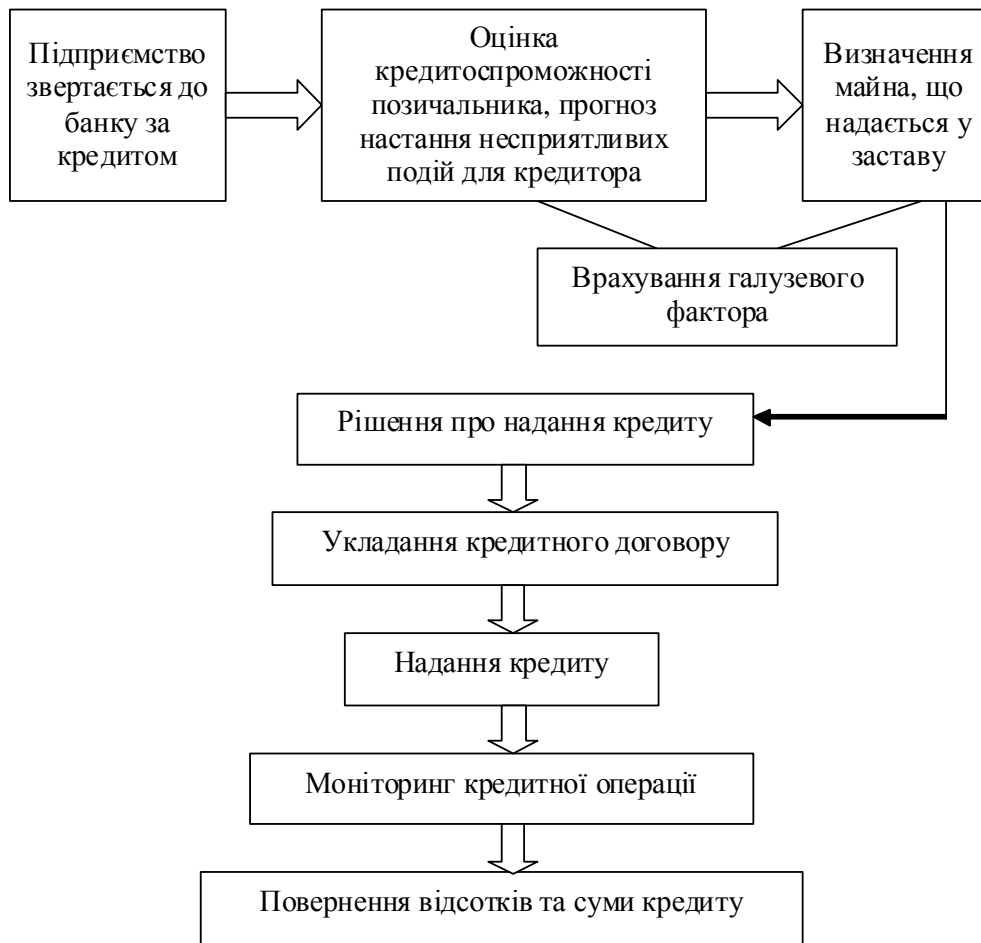
Рис. 1. Врахування галузевих особливостей діяльності позичальника при проведенні банківського кредитування

Схематично підхід до врахування галузевих особливостей діяльності потенційного позичальника представлено на рис. 1.