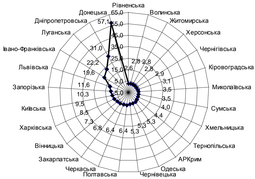
Рис. 2. Викиди шкідливих речовин в атмосферу в розрахунку на квадратний кілометр у 2009 р., т