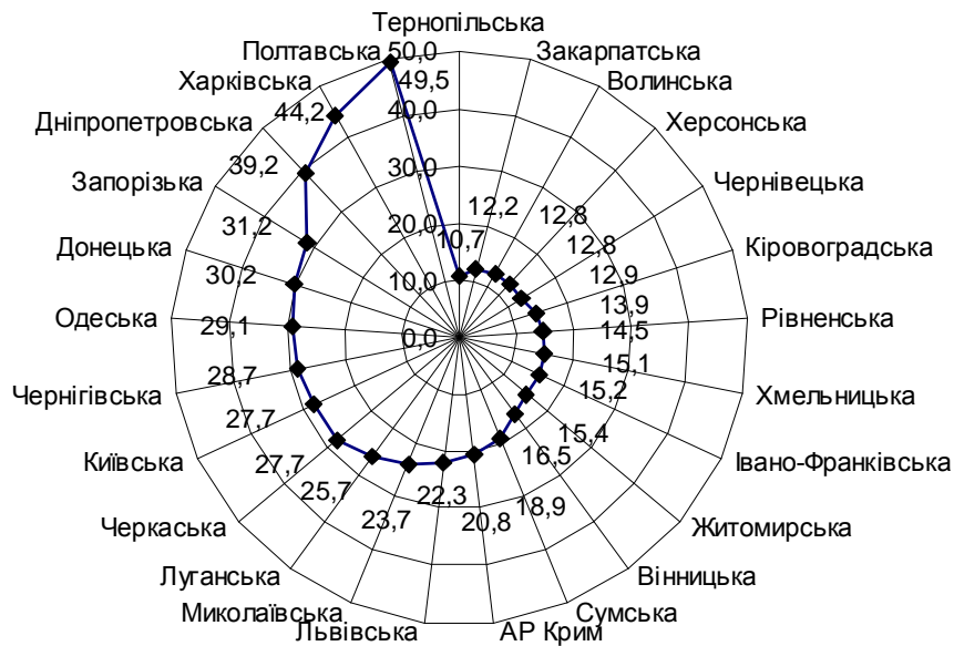
Рис. 3. Податкові надходження на одну особу наявного населення за регіонами України в 2009 р.