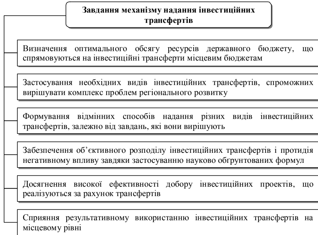
Рис. 1. Основні завдання механізму надання інвестиційних трансфертів

Враховуючи зазначене вище, механізм надання інвестиційних трансфертів має бути орієнтований на вирішення таких завдань (рис. 1).