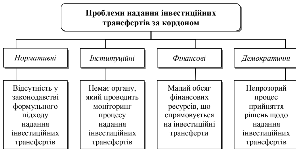
Рис. 5. Проблеми надання інвестиційних трансфертів за кордоном

Отже, вивчення загальносвітового досвіду надання інвестиційних трансфертів дає змогу визначити низку проблем міжбюджетних відносин, які можна згрупувати за типологічними ознаками (рис. 5).