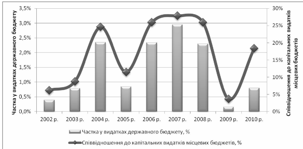
Рис. 3. Динаміка частки капітальних трансфертів з державного бюджету місцевим бюджетам у видатках державного бюджету та їхнє співвідношення до капітальних видатків місцевих бюджетів в Україні у 2002–2010 рр.

сується відповідними альтернативними джерелами фінансування інвестицій місцевих бюджетів, то в Україні вони зазвичай відсутні або дуже обмежені. Це спостерігалось у 2009 р., адже різке скорочення обсягів інвестиційних трансфертів більше, ніж у 15 разів призвело до зменшення капітальних видатків місцевих бюджетів 2,1 разу. У 2010 р. тенденція знову була змінена на протилежну.