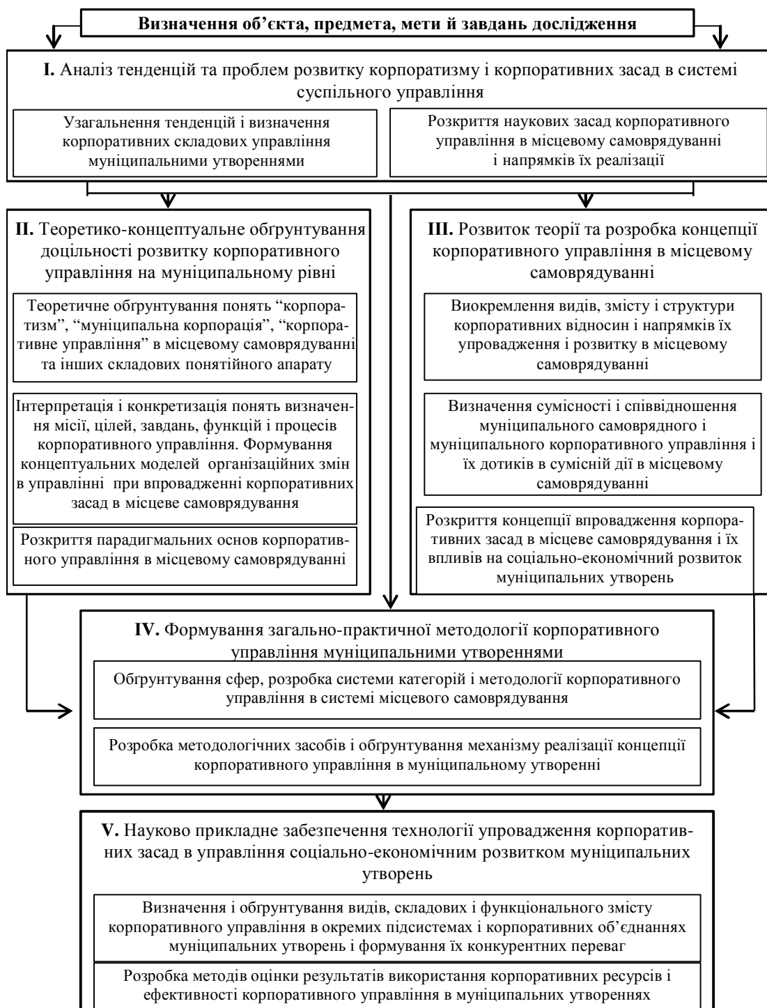
Рис. 2. Концепція і узагальнена схема дослідження проблеми “Розробка методологічних засад впровадження корпоративних підходів в місцевому самоврядуванні з метою підвищення сталості темпів соціального і економічного розвитку”