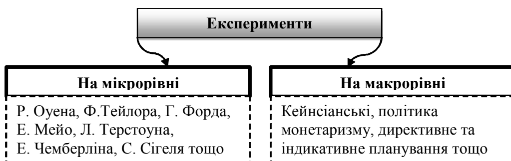
Рис. 1. Види експериментів [1]

Експериментальну економіку можна визначити як напрямок економічної науки, присвячений використанню методу контрольованого експерименту з метою тестування економічних теорій і вивчення поведінки економічних суб’єктів. Економічний експеримент є штучним відтворенням економічних процесів і явищ з метою їхнього вивчення у найбільш сприятливих умовах та подальших практичних змін. Експерименти можуть проводитись як на мікро-, так і на макрорівнях, як за умов ринкової, так і директивної економіки (рис. 1).