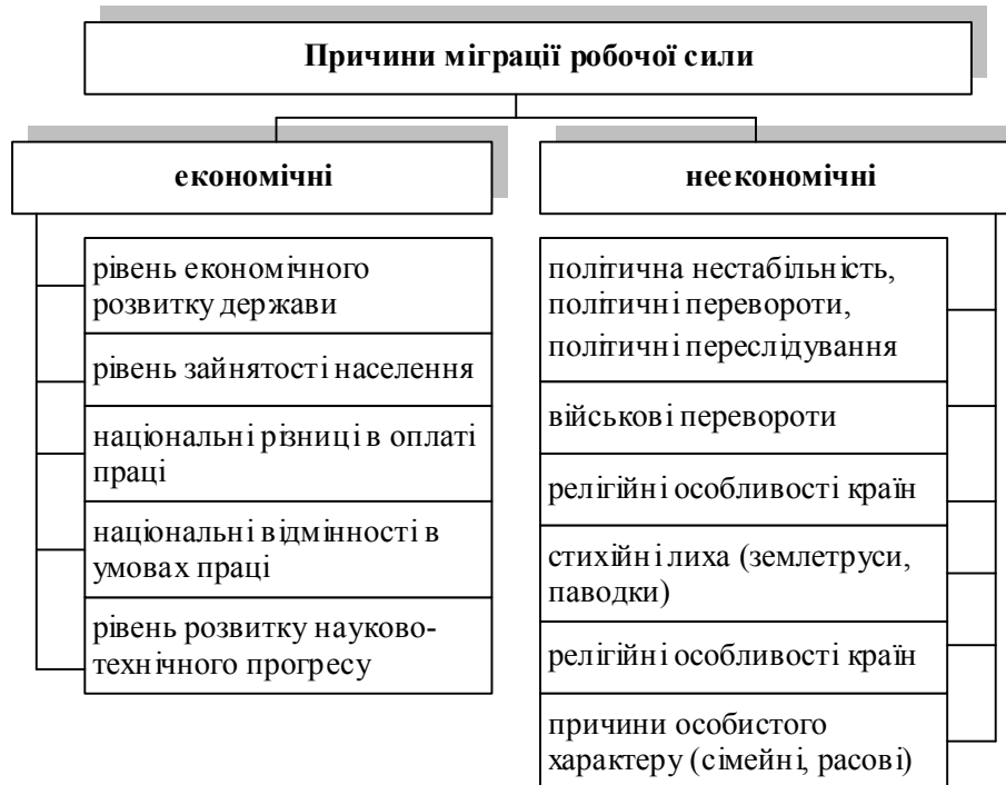
Рис. 1. Причини міграції робочої сили

Виклад основного матеріалу дослідження. Загалом міжнародна міграція робочої сили являє собою переміщення працездатного населення із однієї країни в іншу з метою пошуку роботи, нових сфер реалізації своїх здібностей і кращих умов життя. Як правило, вона здійснюється під впливом економічних і неекономічних (позаекономічних) причин (рис. 1).