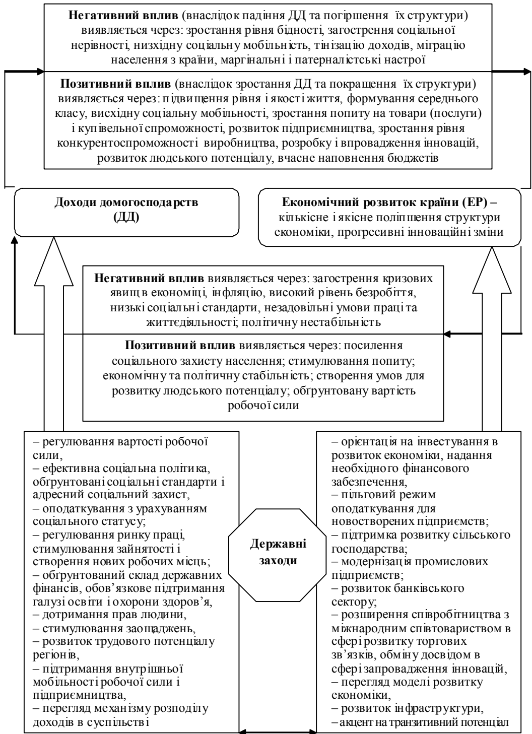
Рис. 2. Вплив динаміки обсягів і структури доходів домогосподарств на економічний розвиток держави