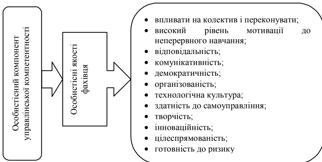
Рис. 4. Зміст особистісного компонента управлінської компетентності бакалаврів економічних спеціальностей

– кваліфікація та особистісні якості індивіда. Отже, для досягнення успіху сучасному фахівцю необхідно мати не тільки високу кваліфікацію, а й певні переваги над іншими [5]. Для менеджера і підприємця це “щось” означає комплекс умінь та особистісних якостей, який ми узагальнили в особистісний компонент управлінської компетентності (рис. 4).