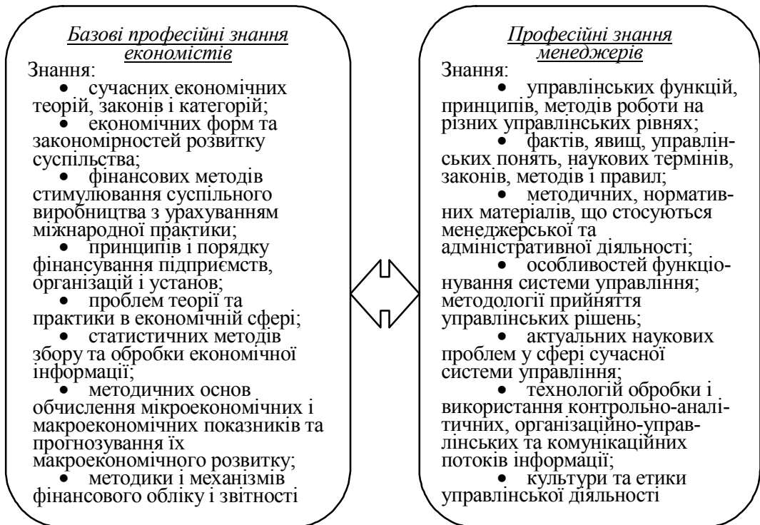
Рис. 1. Зміст когнітивного компоненту управлінської компетентності бакалаврів економічних спеціальностей

Таким чином, на основі вивчення нормативних документів та загальних положень теорії менеджменту ми розробили зміст когнітивного компонента управлінської компетентності бакалаврів економічних спеціальностей з урахуванням вимог ринку праці та інтересів майбутніх фахівців економічних спеціальностей. Він має дві складові: базові професійні знання економістів та професійні знання менеджерів, що відображено на рис. 1.