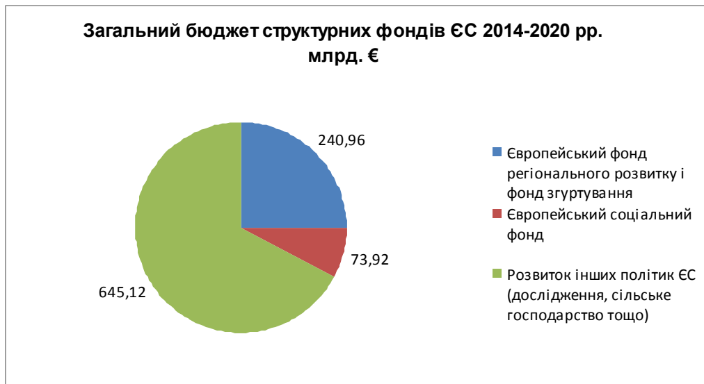
Рис 2. Загальний бюджет структурних фондів ЄС 2014–2020 рр.

Кошти нового бюджету 2014–2020 рр. будуть направлені на зміцнення зв'язку між політикою гуртування та іншими спільними політиками Європейського Союзу, а також на