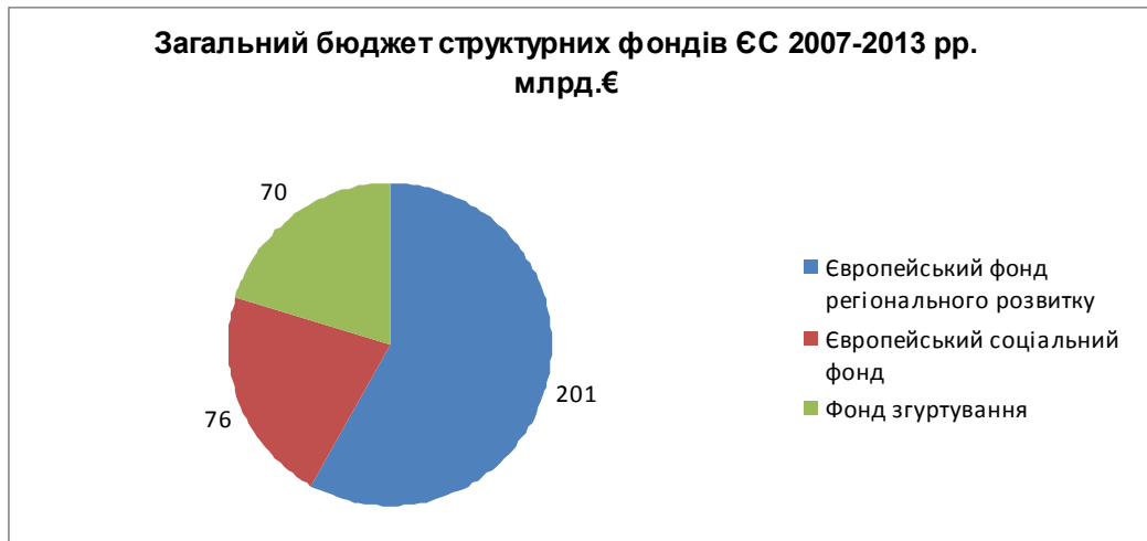
Рис 1. Загальний бюджет структурних фондів ЄС 2007–2013рр.

На рис. 1. і рис. 2. представлено загальні бюджети структурних фондів ЄС у 2007–2020 рр. [14].