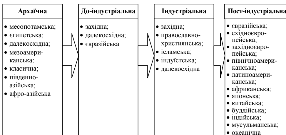
Рис. 3. Фази економічного розвитку цивілізації

Локальні цивілізації, які виникли близько шести тисячоліть тому в межах стародавніх держав та їх об'єднань – у Шумері, Єгипті, Індії, змінювалися, зникали, трансформувалися у цивілізації нових поколінь. Експерти виділяють 4 фази економічного розвитку, за якими і класифікують цивілізації (див. рис. 3) [12].