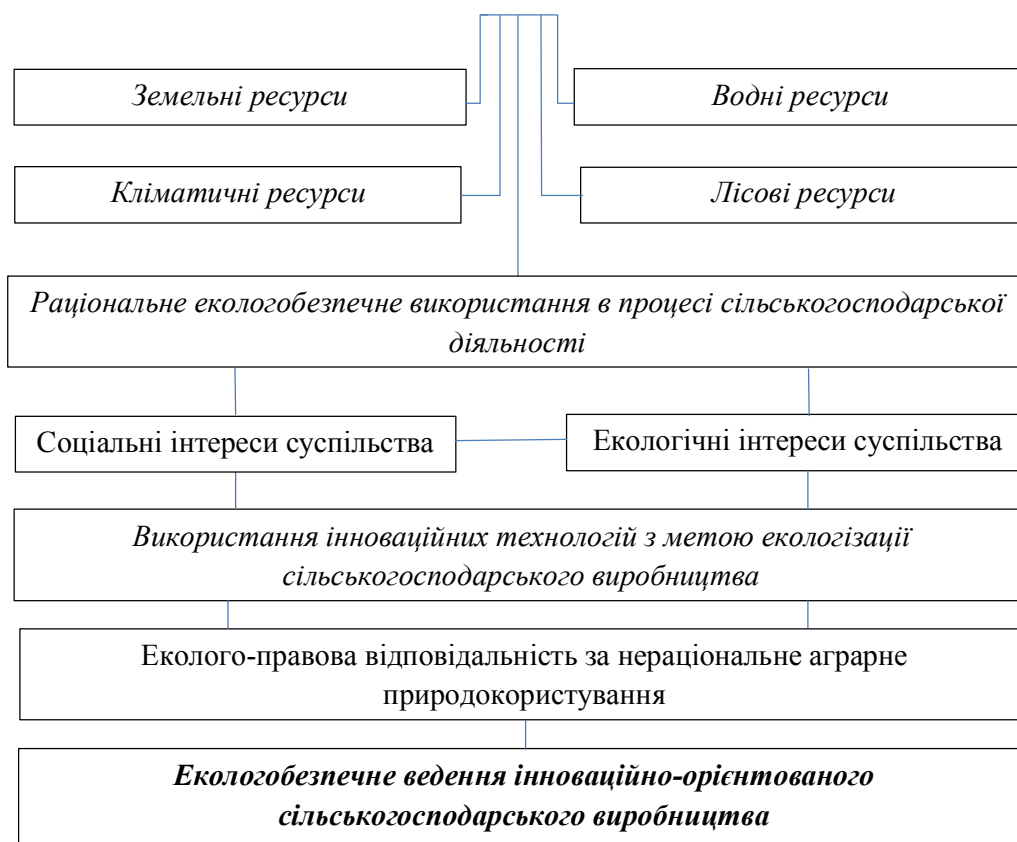
Рис. 1. Система забезпечення та використання природно-ресурсного потенціалу в процесі екологічнобезпечного ведення інноваційно-орієнтованого сільськогосподарського виробництва

(36,7% від їх загальної площі), у тому числі орних земель 44,8% від загальної площі ріллі [5].