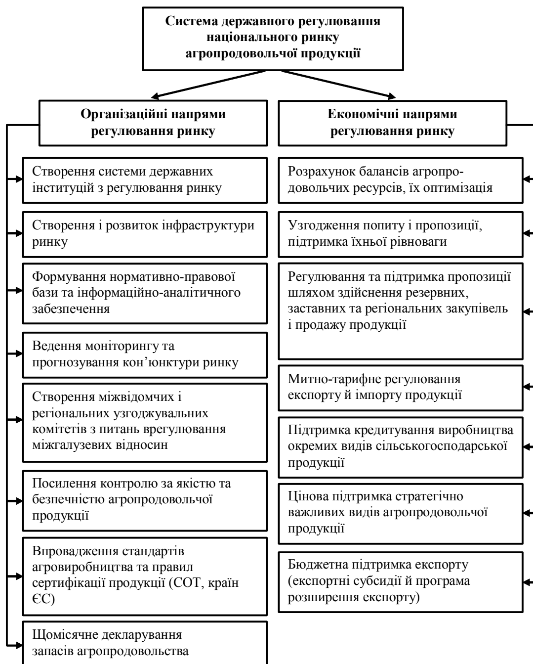
Рис. 2. Пропонована модель системи державного регулювання національного ринку агропродовольчої продукції